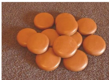
Kit 12 pierres froides tarif indicatif 25€

Afin de pouvoir mettre en pratique ce que vous avez appris à l'issue de certaines formations, il vous appartiendra d'acquérir du matériel spécifique détaillé ci-dessous. Ce matériel pourra être acquit sur place le jour de la formation.